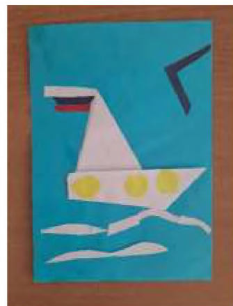
Выставка совместного творчества с родителями «Новая жизни, из старых вещей»