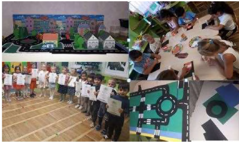
Совместное информационно – просветительское мероприятие с сотрудниками роты ДПС г. Анапа.