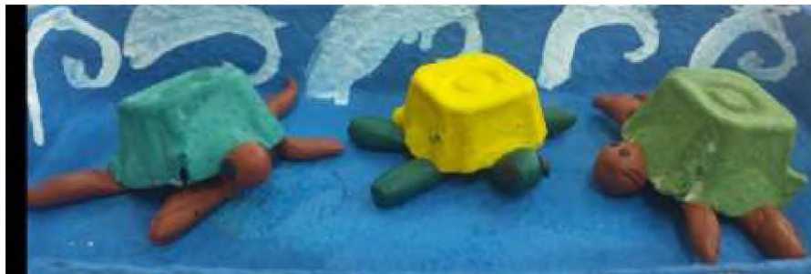
Коллективная работа «Знатоки Черного моря» (к международному дню Черного моря)